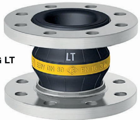
Type ERV-G LT

Innen : NBR (Nitril), nahtlos, abriebfest Druckträger : PA-Textilcord Außen : Chloropren CR Kennzeichnung : Gelber Ring mit weißem 'LT'-Aufdruck, ERV DN ..., PN 16, Herstellungsdatum Flansche 1) : Drehbar, DIN PN 10/16, Stahl, verzinkt